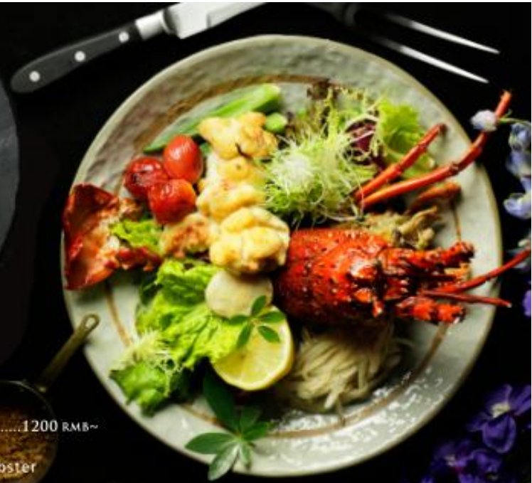
T09 ISE-EBI .....1200 RMB~ 伊勢海老 Japanese Lobster 日本大龙虾