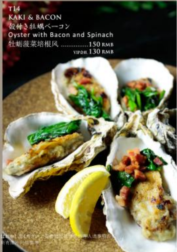
T14 KAKI & BACON 殻付き牡蠣ベーコン Oyster with Bacon and Spinach 牡蛎菠菜培根风 .....150 RMB VIP价 130 RMB