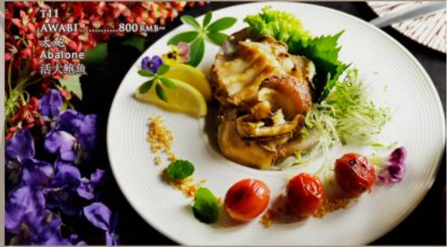
T11 AWABI .....800 RMB~ 大鲍 Abalone 活大鲍鱼