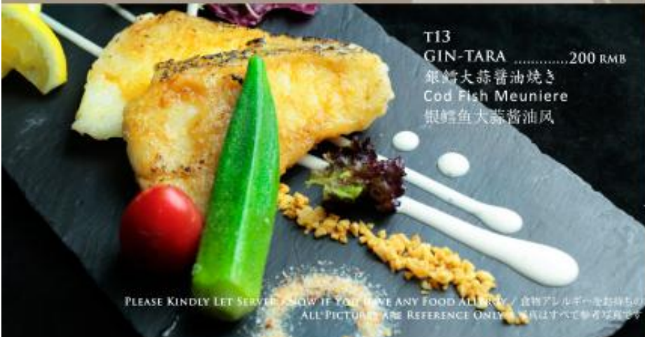
T13 GIN-TARA .....200 RMB 银鲑大蒜酱油焼き Cod Fish Meuniere 银鲑鱼大蒜酱油风

PLEASE KINDLY LET SERVICE KNOW IF YOU HAVE ANY FOOD ALLERGY / 食物アレルギーをお持ちの方は事前に申し出ください。アレルギー対応は事前の要請を必ずご確認ください。 ALL PICTURES ARE REFERENCE ONLY. 写真はすべて参考写真です。/ 所有圖片均供參考。