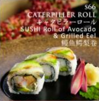
S66 CATERPILLER ROLL キャタピラーロール SUSHI Roll of Avocado & Grilled Eel 鳗鱼鳄梨卷