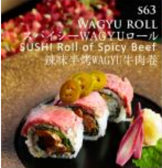
S63 WAGYU ROLL スパイシーWAGYUロール SUSHI Roll of Spicy Beef 辣味半烤WAGYU牛肉卷