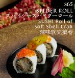
S65 SPIDER ROLL スパイシーズパイダーロール SUSHI Roll of Soft Shell Crab 辣味软壳蟹卷