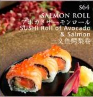
S64 SALMON ROLL アボカドサーモンロール SUSHI Roll of Avocado & Salmon 三文鱼鳄梨卷