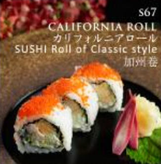
S67 CALIFORNIA ROLL カリフォルニアロール SUSHI Roll of Classic style 加州卷

S60 CHEF SUSHI ROLL 10 料理長おすすめロール寿司盛り 十貫 Chef's Recommendation of SUSHI Roll Platter 10pcs 料理長推荐卷寿司拼盘 十贯 .....180 RMB VIP 170 RMB