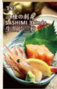
TS3 三種の刺身 SASHIMI 3kinds 生鱼片三種