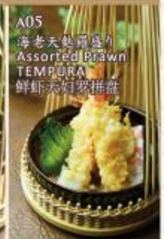
A05 海老天鰹扇貝 Assorted Prawn TEMPURA 鮮蝦天妇罗拼盘