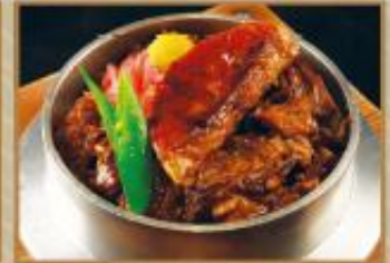
LK03 牛煮込みフォアグラ釜めし Stewed Beef & Foie Gras on Hot-pot Rice 牛肉鹅肝铁锅饭