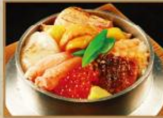
LK02 蟹三昧北海道鮮釜めし Crab & Seafoods on Hot-pot Rice 蟹肉北海道海鲜铁锅饭