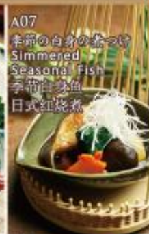
A07 季節の白身の煮つけ Simmered Seasonal Fish 季節白身魚 日式紅燒魚